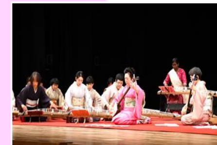
清音会石橋社中さん

琴、三弦の教室です。基本的な曲から大曲まで、そして、ポップから古典まで幅広く研鑽を積んでいます。ボランティア活動として施設などでも楽しんでいただいています。