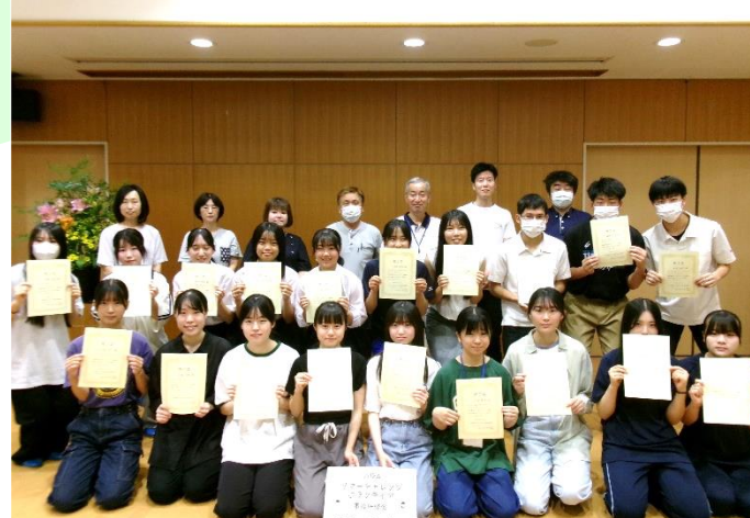
最後は修了証を持って記念撮影

「利用者の笑顔に元気をもらえた」 「コミュニケーションの大切さを学んだ」という感想が寄せられ、参加者全員が成長を感じる有意義な時間となりました。