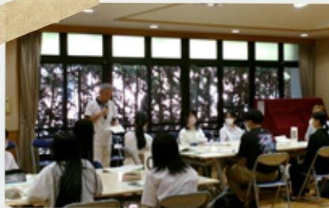
施設担当者の方から温かいコメント