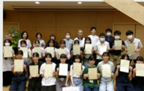
修了証を手にみんなで記念撮影