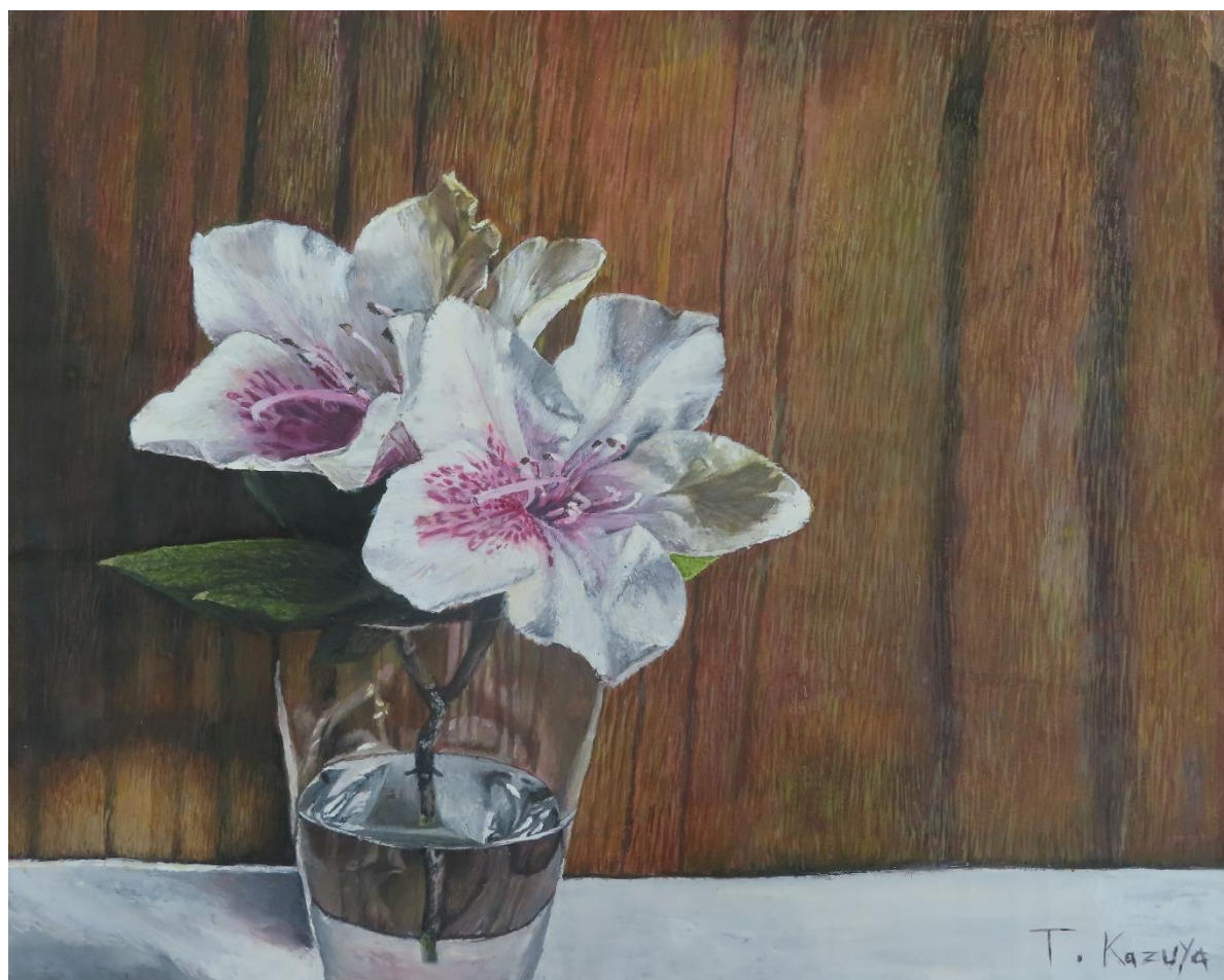
作者:高橋 和也 氏(ふれジョブ乃木体験者、乃白町在住)