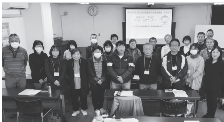
令和6年度市民後見人等養成講座〈実務編〉の最終日に受講されたみなさん

市民後見人等養成講座の修了者数 および市民後見人の選任状況 (令和6年12月末時点)