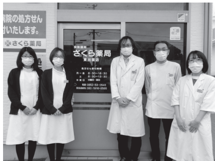
ふくしなんでも相談連携薬局 ～さくら薬局 東出雲店～