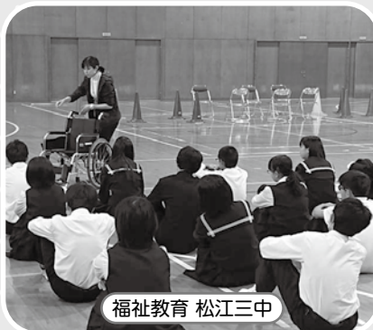
福祉教育 松江三中

地域には介護保険等の公的サービスだけでは解決できない「法的整備が遅れている」「サービスがない」課題が山積しています。制度の狭間の福祉課題、地域の特性を活かした地域福祉活動の推進のために社協会費が必要とされています。