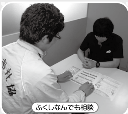
ふくしなんでも相談