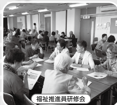
福祉推進員研修会

社会福祉協議会は、社会福祉法に位置付けられた「地域福祉の推進を図ること」を目的とした民間の自主組織です。地域の皆様やボランティア、保健・福祉関係者、行政機関などのご参加・ご協力を得て地域福祉活動を推進しています。