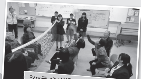
シットイングバレー:それ!アタック~!