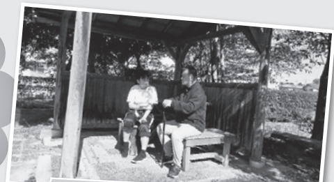
休憩中…楽しい会話が弾む年の差50歳