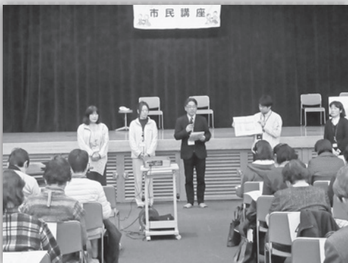
地域に事業のご説明におうかがいします。