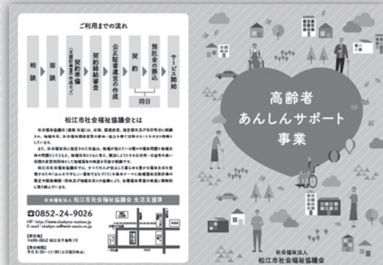
あんしんサポート事業パンフレット

まずは生活支援課(☎24-9026 FAX:27-3789)までお問い合わせください。