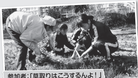
参加者:「草取りはこうするんよ!」 高校生:「早い! 神の手だ!」