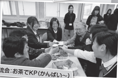
交流会:お茶でKP(かんばい~)