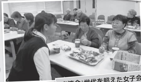
交流会:世代を超えた女子会?